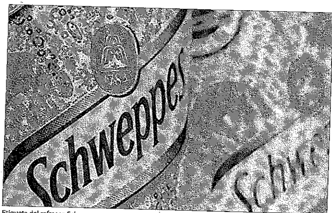
Etiqueta del refresco Schweppes.

■ BBVA e Inditex se han situado a la cabeza de la lista de Top Companies for Leaders 2007 en Europa, detrás de la finlandesa Nokia. El banco, en el primer puesto junto a Nokia, y el grupo textil, en segundo, figuran por delante de compañías europeas como GlaxoSmithKline (Reino Unido), L'Oréal (Francia), Randstad Holding (Holanda), Deutsche Lufthansa (Alemania), UBS (Suiza), SAP (Alemania) y BMW (Alemania). En el estudio, hecho público ayer, han participado más de 540 compañías del mundo. Las empresas han sido seleccionadas por un panel de jueces independientes y evaluadas según distintos criterios, incluyendo prácticas de liderazgo, reputación, cultura de liderazgo, valores y rendimiento.